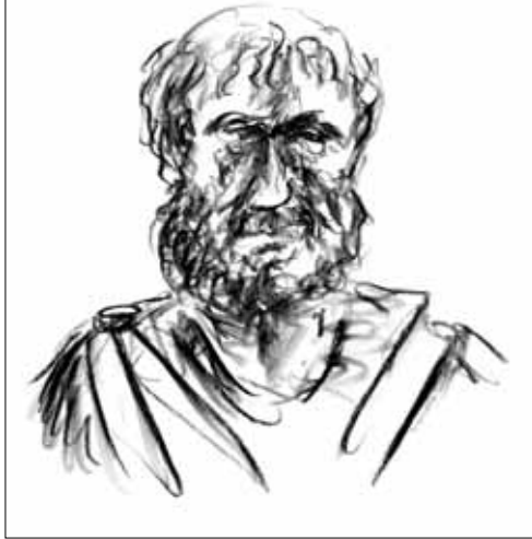
Vordenker der Zivilgesellschaft: Aristoteles

Putnam sind neben vielen anderen ebenfalls vertreten.